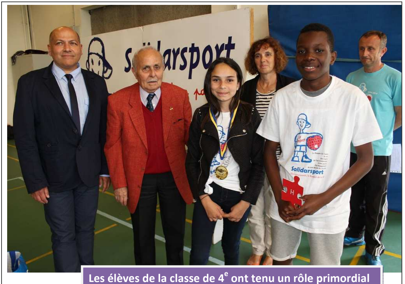
Les élèves de la classe de 4 e ont tenu un rôle primordial de soutien aux côtés de l'équipe d'organisation