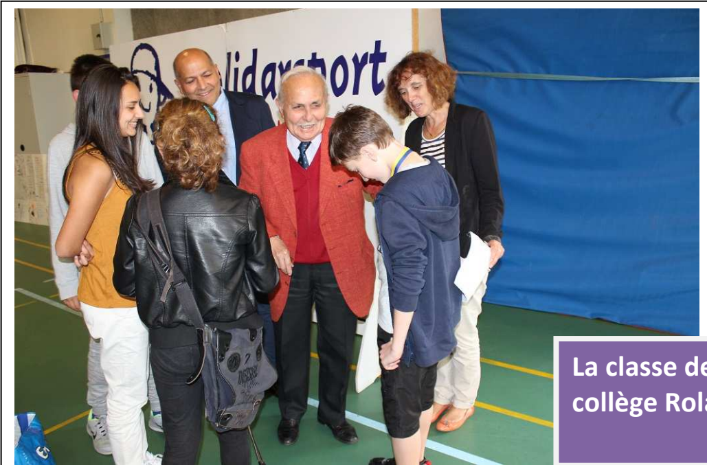
La classe de 6 e 5 du collège Roland Garros