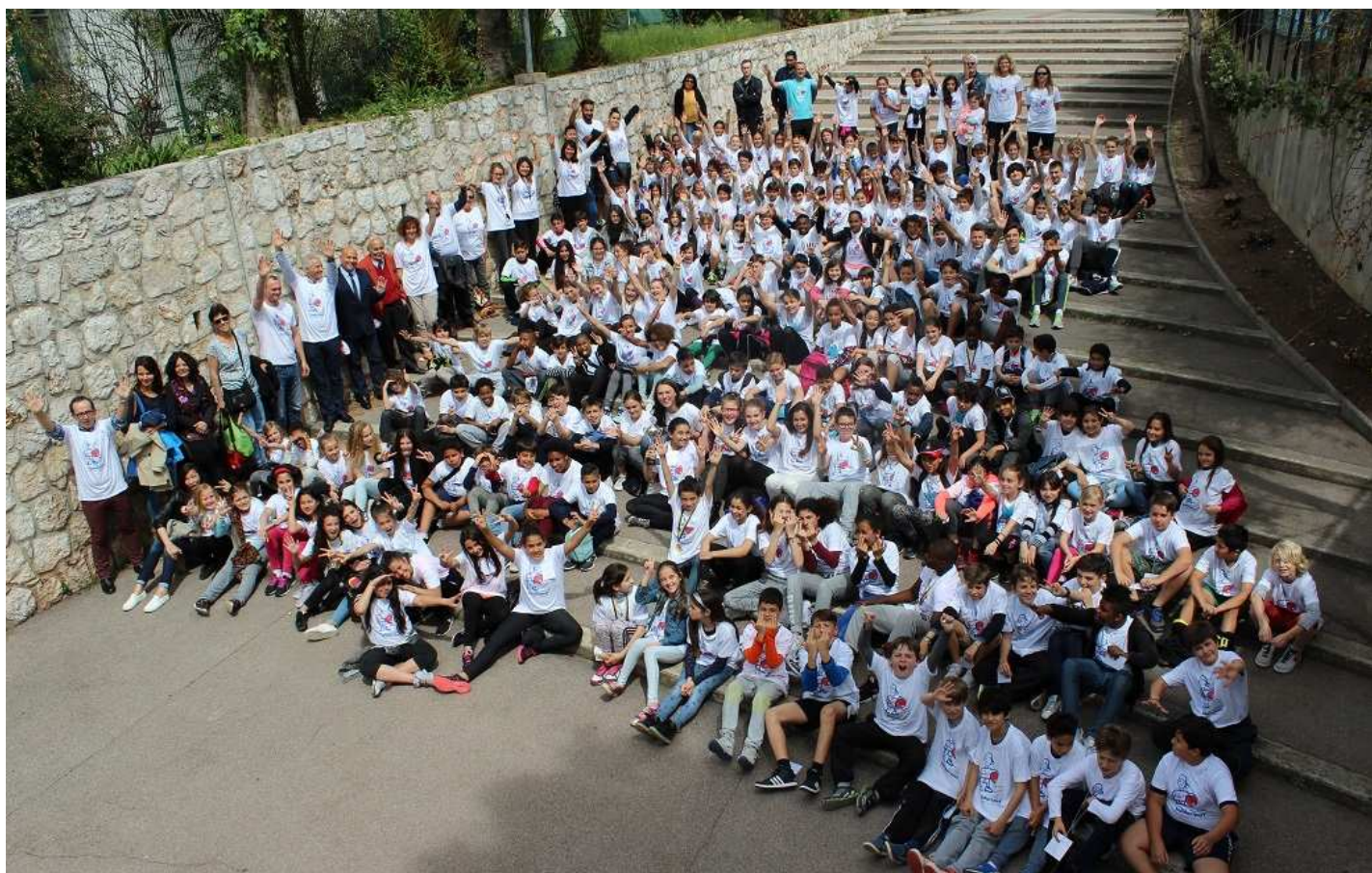
Les 140 jeunes participants à cette journée entourés par l'équipe d'organisation et les responsables des ateliers.