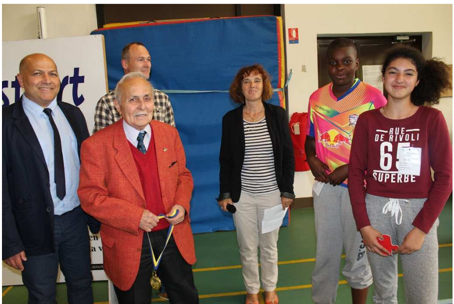
La Classe de 6 e 3 du collège Roland Garros