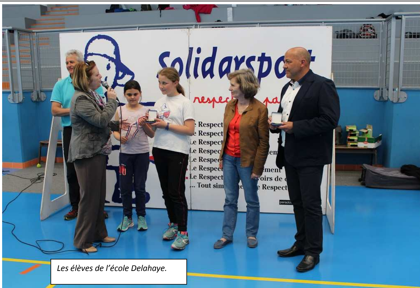
Les élèves de l'école Delahaye.