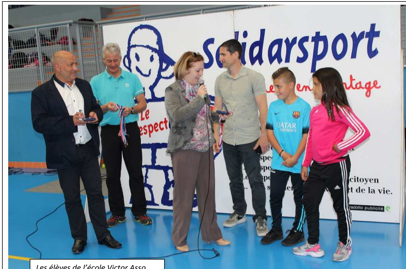
Les  l ves de l' cole Victor Asso.