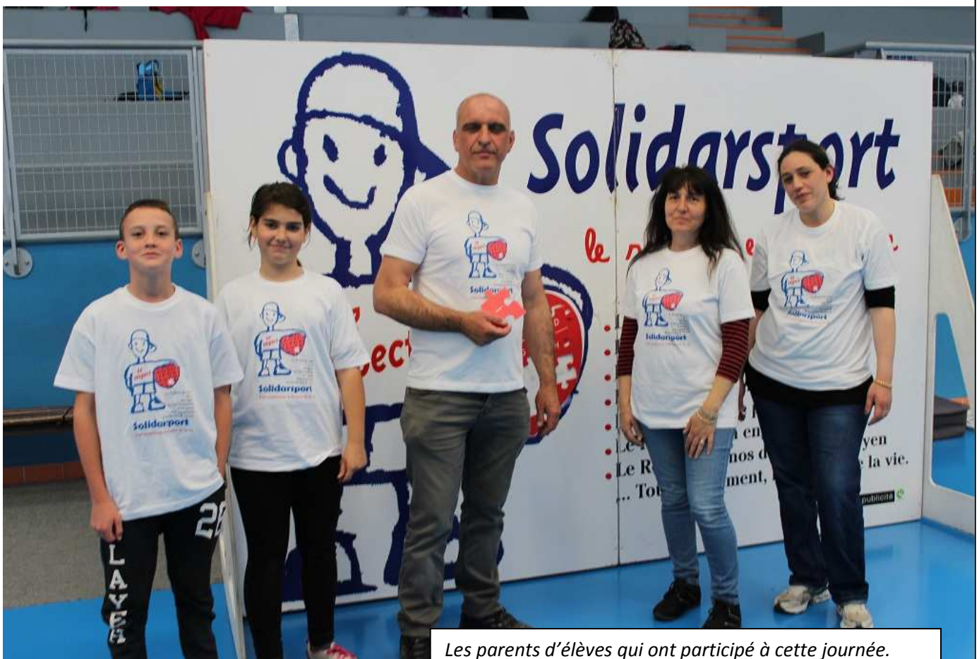
Les parents d'élèves qui ont participé à cette journée.