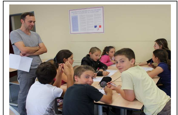
Maths – M. Frechet