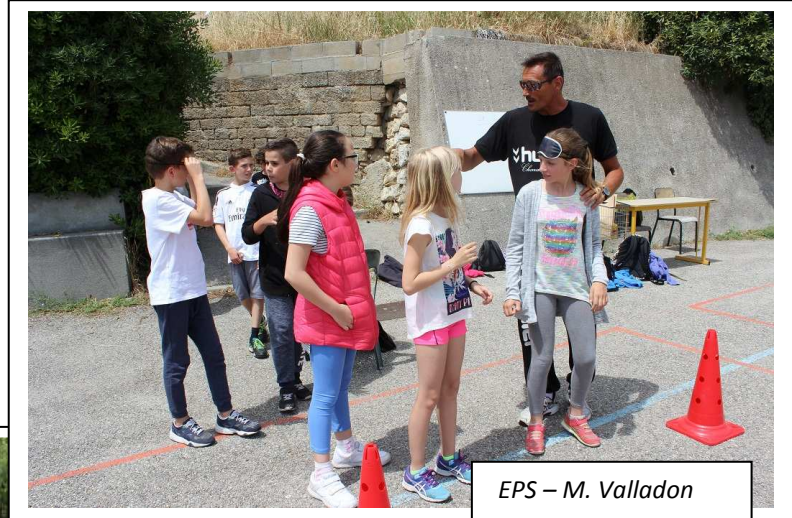
EPS – M. Valladon