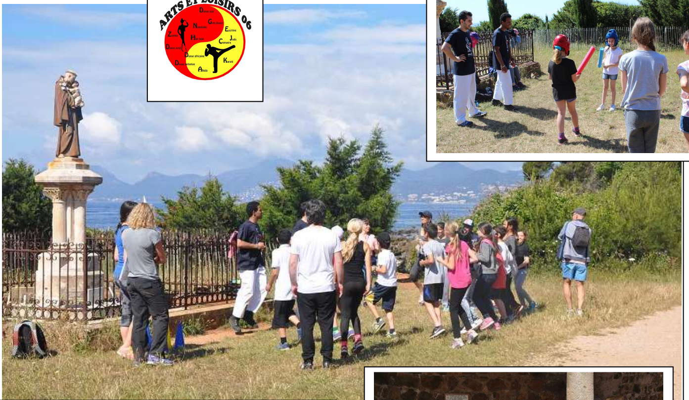
La rigueur des règles en karaté avec deux jeunes représentants de l'association « ARTS ET LOISIRS 06 » de Euloge Konan.