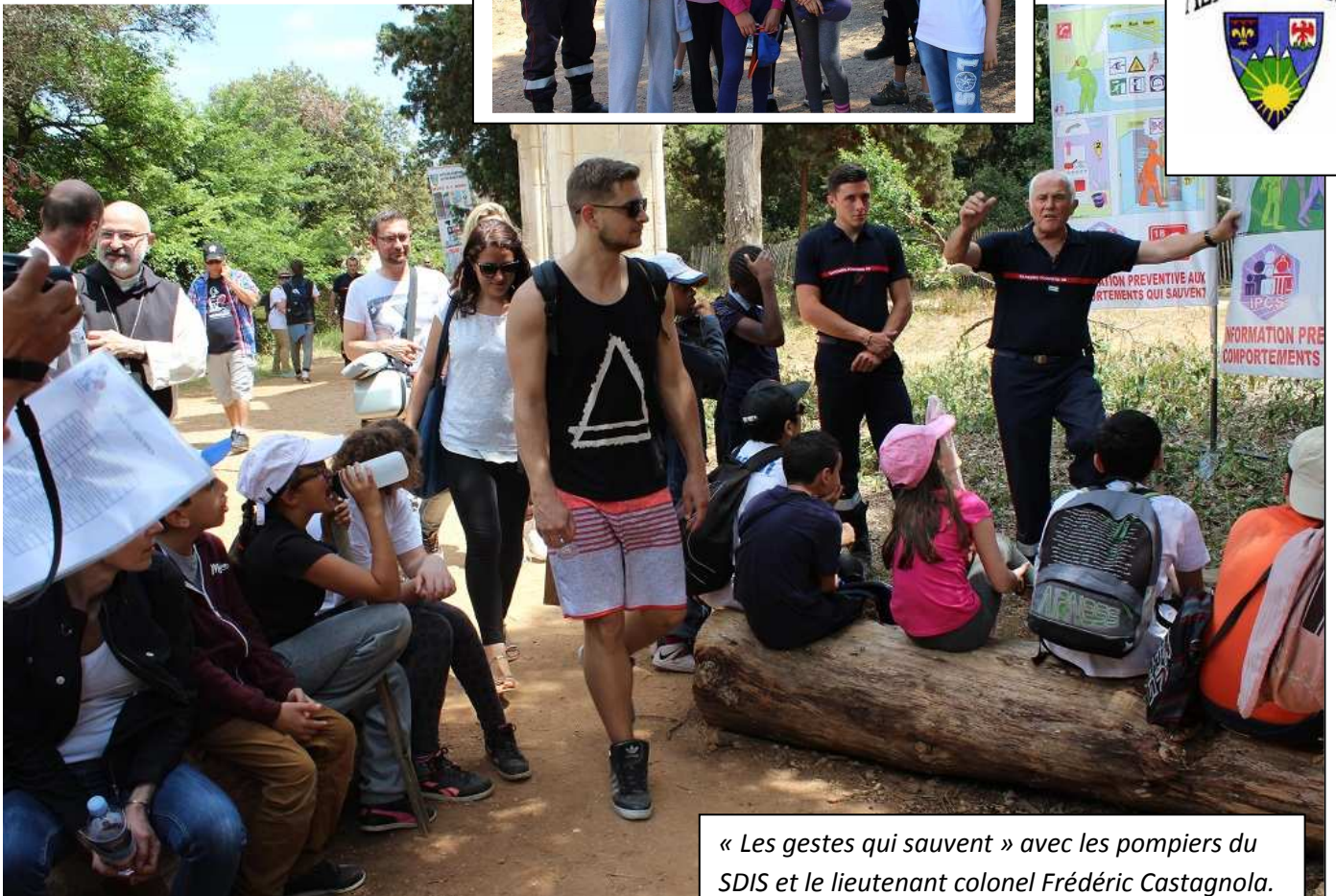
« Les gestes qui sauvent » avec les pompiers du SDIS et le lieutenant colonel Frédéric Castagnola.