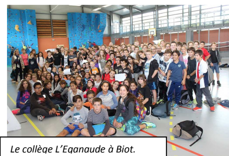
Le collège L'Eganaude à Biot.