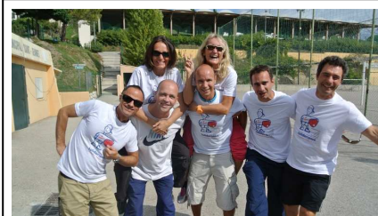
Le collège Les Baous à Saint-Jeannet..