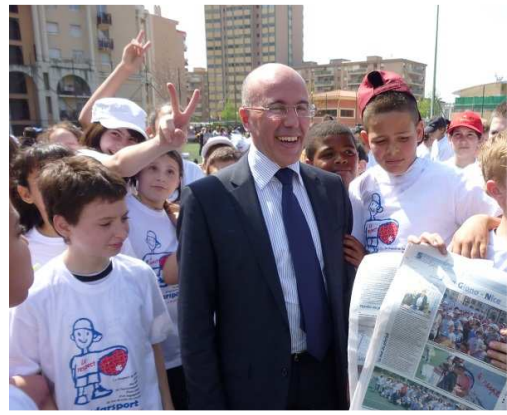
M. Eric Ciotti, Président du Conseil Départemental des Alpes- Maritimes.