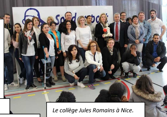
Le collège Jules Romains à Nice.