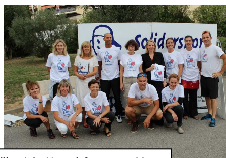
Le collège Jules Verne à Cagnes-sur-Mer.

Pour la prochaine édition seront invités à participer les lycées avec lesquels Solidarsport a tissé des liens : Thierry Maulnier et La Providence (Nice) ; le CIV de Valbonne et Hutimel (Cannes-La-Bocca) qui sera le premier établissement scolaire à organiser un « Journée du Respect » à la prochaine rentrée scolaire... ce sera le 5 septembre !