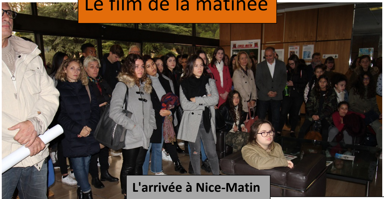
L'arrivée à Nice-Matin