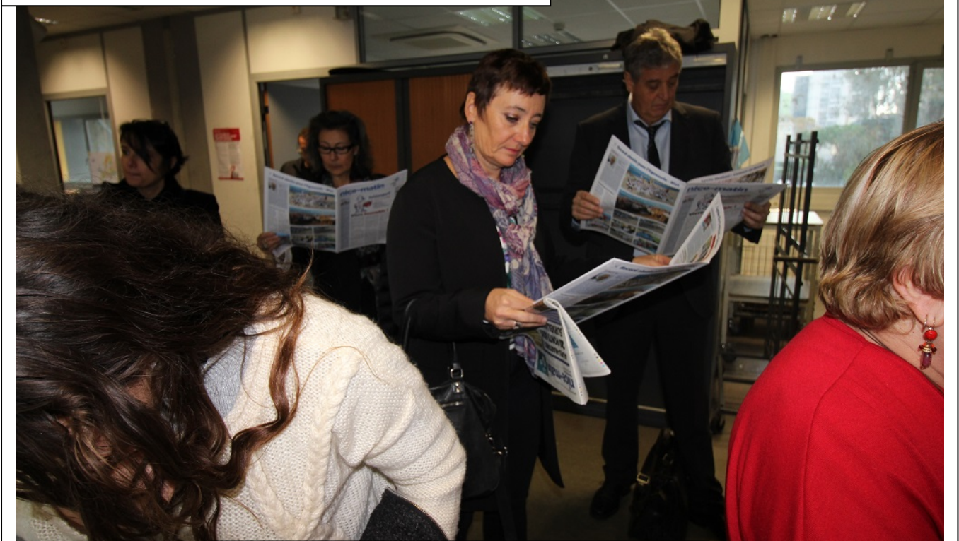
Avec la délégation du lycée De Croisset de Grasse.