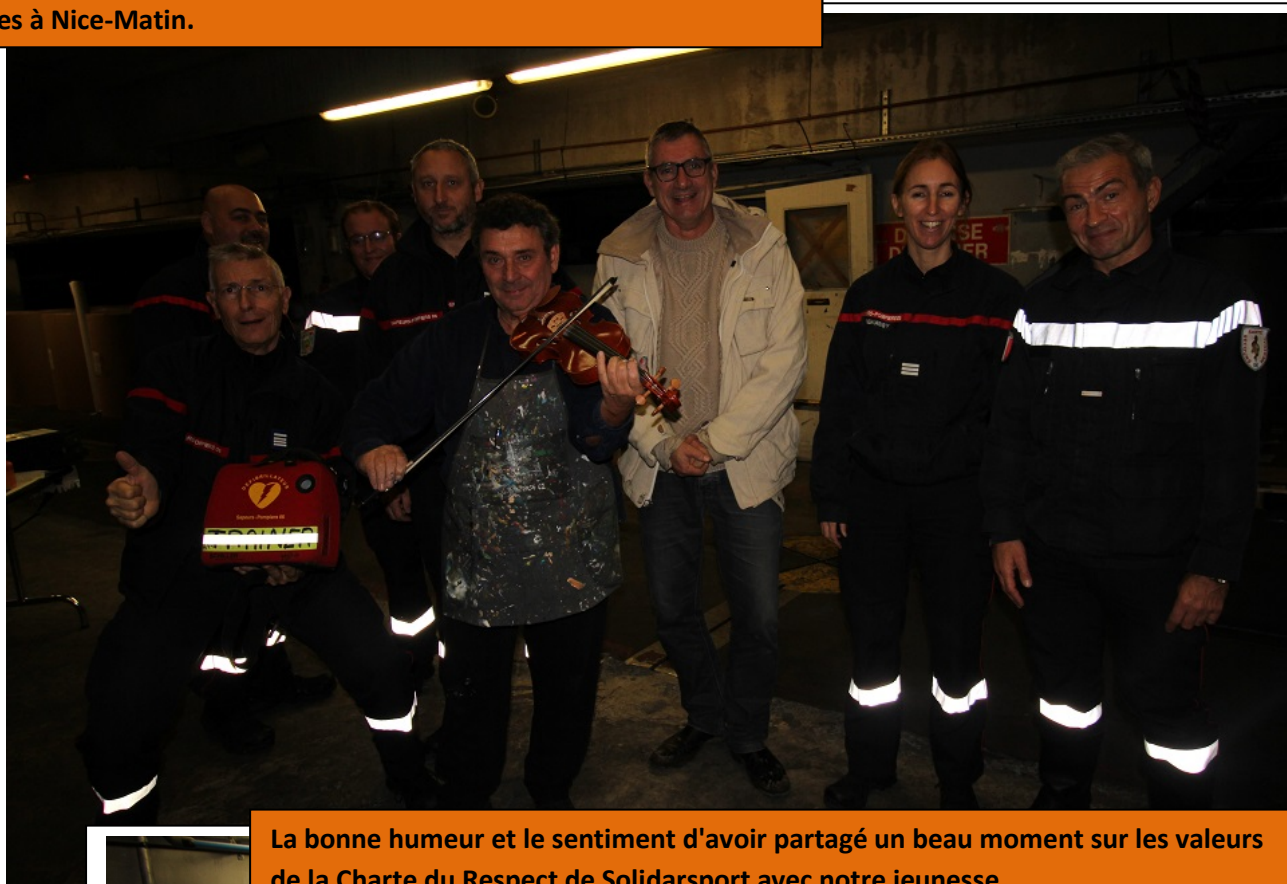
La bonne humeur et le sentiment d'avoir partagé un beau moment sur les valeurs de la Charte du Respect de Solidarsport avec notre jeunesse.