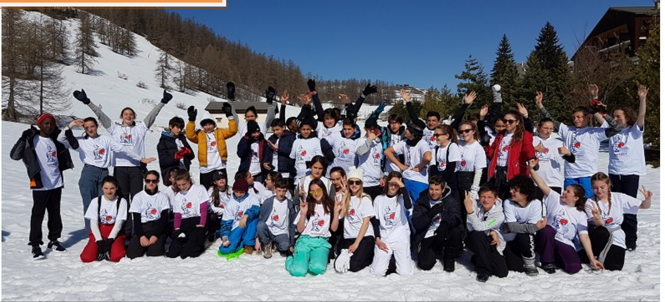
Les 45 élèves du collège Mistral à Valberg : ils ont été récompensés pour leurs valeurs citoyennes.