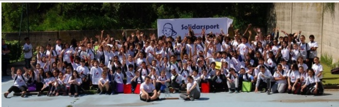
220 élèves de 6 e ont participé le vendredi 20 avril à une "Journée Solidarsport" au collège Mistral. C'était la 8 e édition !