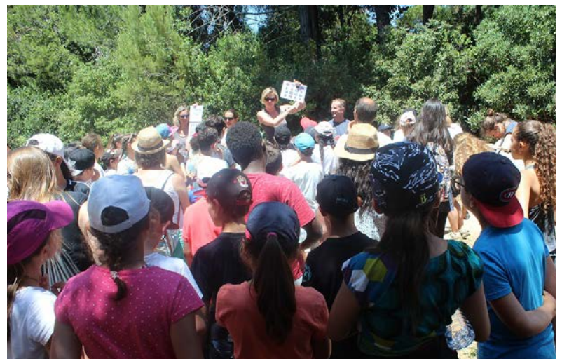
La présentation aux élèves du déroulement de la journée..