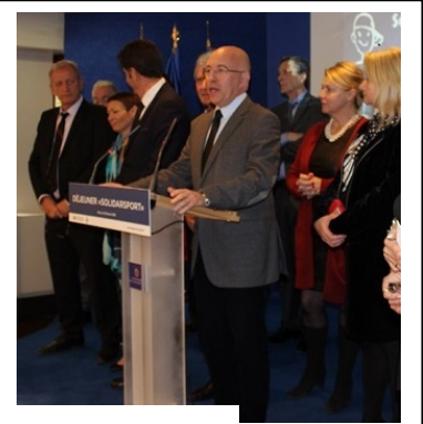
M. Eric Ciotti.