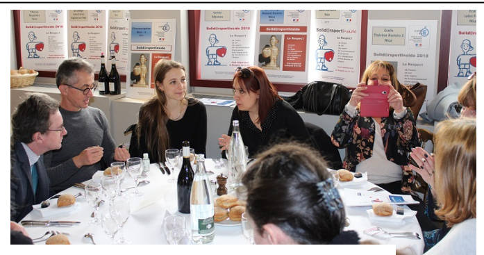
A la table des responsables d'écoles primaires