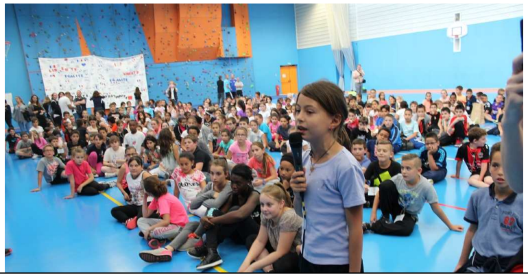
C'est une élève de CM2 qui a lu devant tous ses camarades au terme de la journée le poème de René Philombé.