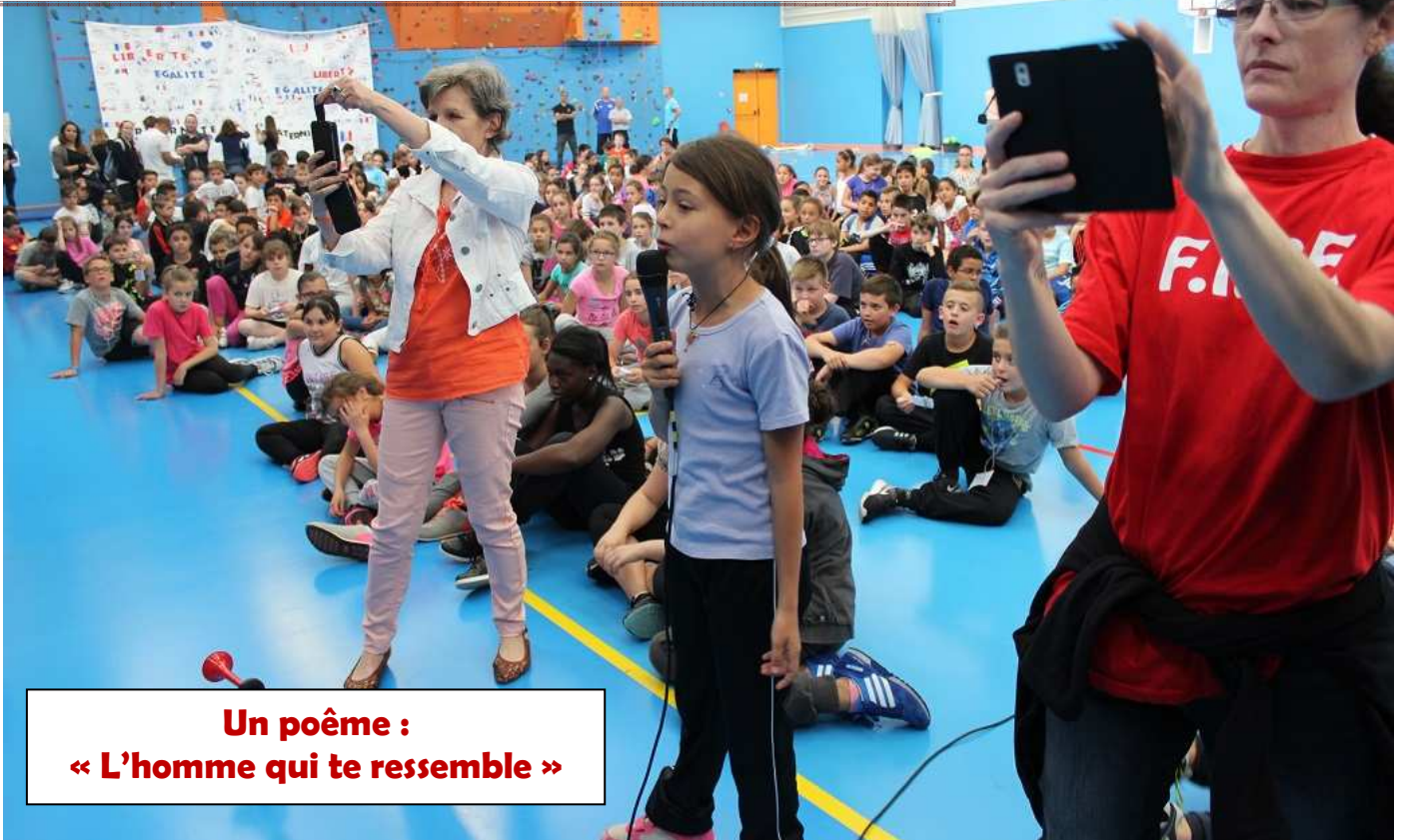
Un poème : « L'homme qui te ressemble »