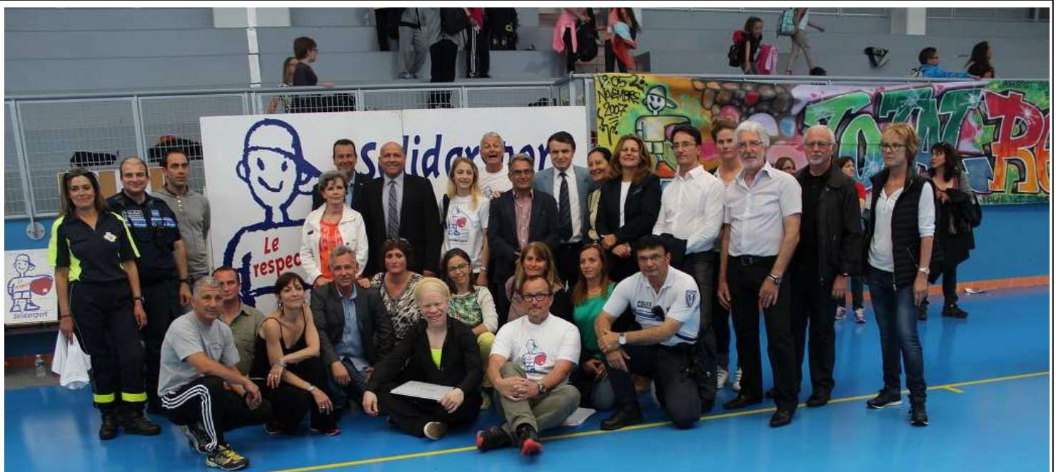
Les personnalités et les responsables d'ateliers.