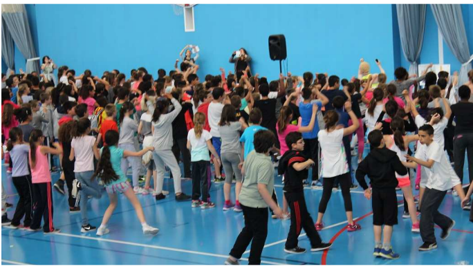
Une salsa gigantesque en final