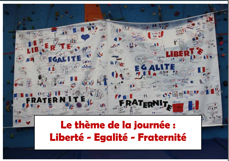
Le thème de la journée : Liberté - Égalité - Fraternité