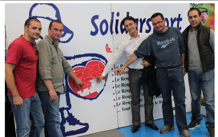
L'équipe du Comité de développement durable d'Auchan.