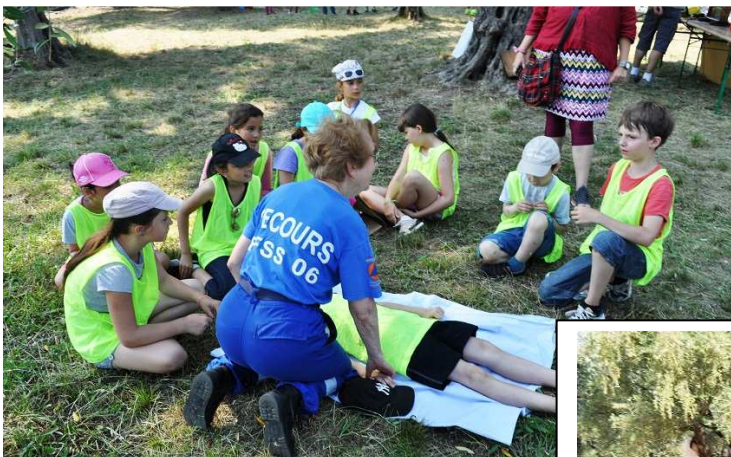
Les gestes qui sauvent