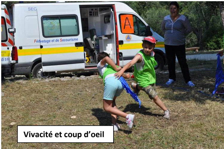
Vivacité et coup d'oeil