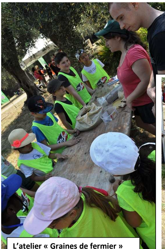
L'atelier « Graines de fermier »