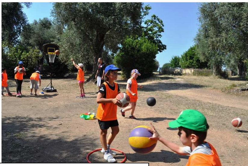
Le basket avec le Cavigal de Nice