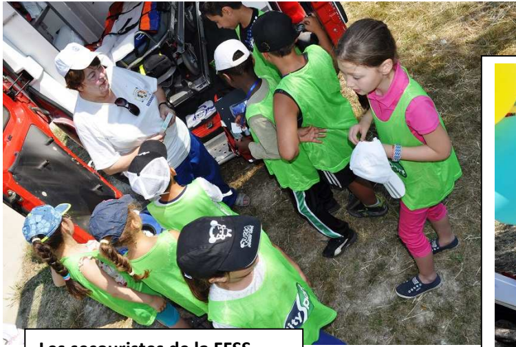
Les secouristes de la FFSS