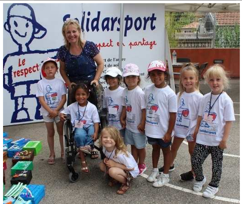
Le « Mur du Souvenir » en hommage aux victimes de l'attentat du 14 juillet 2016 sur la Promenade des Anglais à Nice. Près de 260 boîtes à chaussures en carton ont été peintes par les 260 élèves participant à cette « Journée du Respect » sous la conduite de Mme Micheli-Dhoste.