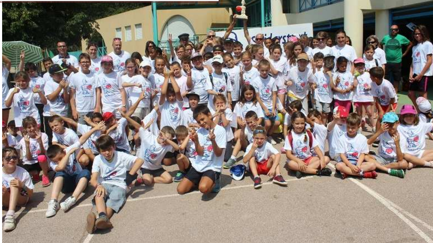
Les élèves brandissent la céramique du « Petit Bonhomme Solidarsport » qui trône désormais en bonne place à l'école de La Plana.