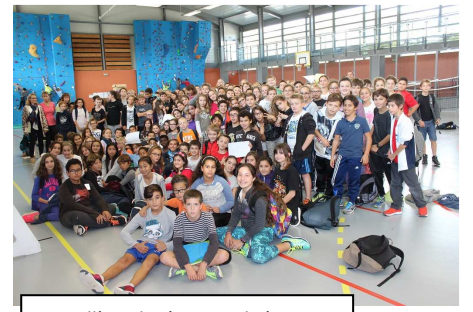
Le collèqe de L'Eqanaude à Biot.