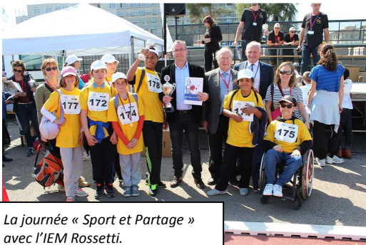
La journée « Sport et Partage » avec l'IEM Rossetti.