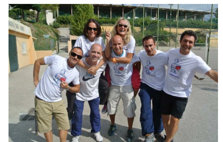
Le collège Les Baous à Saint-Jeannet..