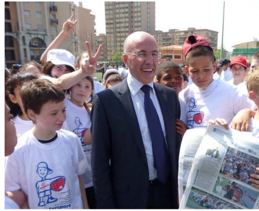
M. Eric Ciotti, Président du Conseil Départemental des Alpes- Maritimes.