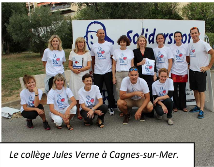
Le collège Jules Verne à Cagnes-sur-Mer.