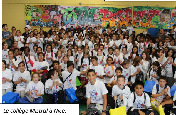
Le collège Mistral à Nice.