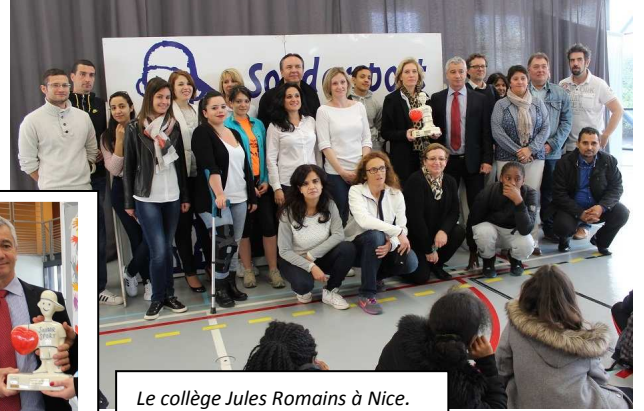
Le collège Jules Romains à Nice.