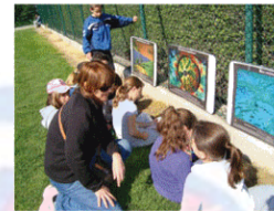
B - Sciences et Vie de la Terre