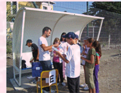
D - Anglais