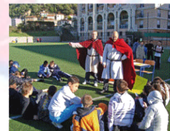
F - Histoire et géographie