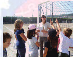
C - Français