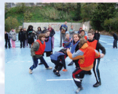
E - Education sportive