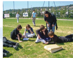
A - Mathématiques

Les enseignants adaptent et déclinent les valeurs de la charte à leur propre discipline. Ainsi chaque atelier devient un «laboratoire expérimental» du RESPECT.