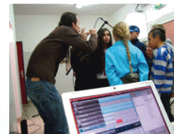
H - Musique