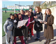
G - Vie scolaire