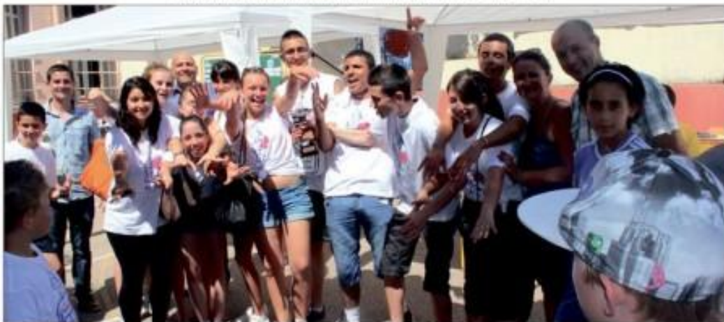
Les élèves de seconde du lycée René Goscinny à Drap, ont été de remarquables « capitaines » d'équipes.