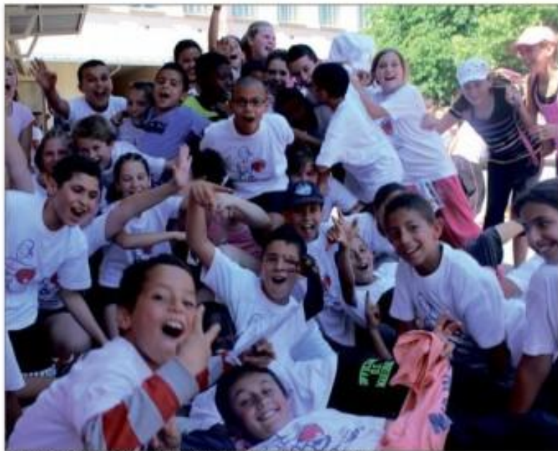
Les élèves des classes primaires laissent éclater leur joie, à l'issue de cette journée.