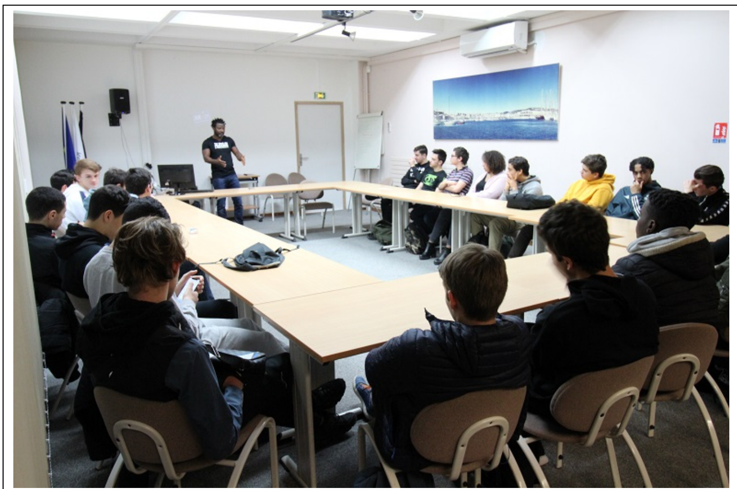
Un échange à bâtons rompus entre les lycéens et l'artiste rappeur Rost, originaire de la banlieue parisienne.